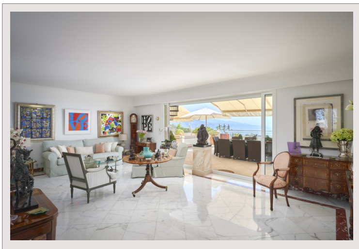
logement très performant