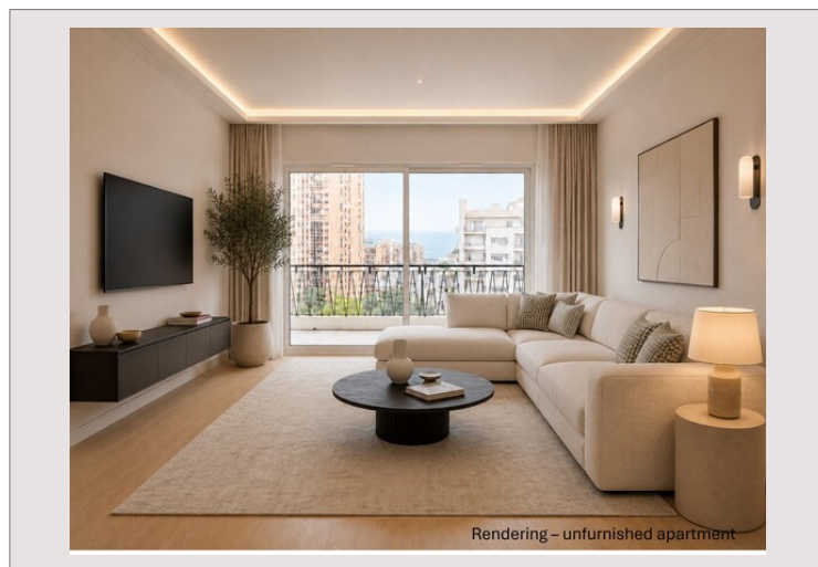
Rendering – unfurnished apartment