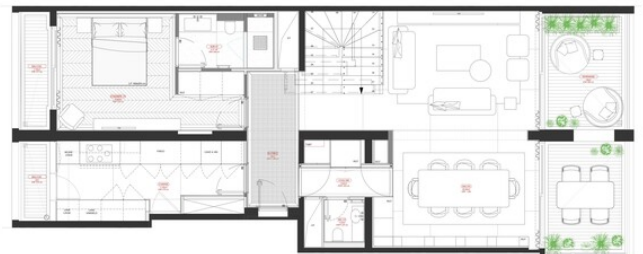
1 PLAN PROJET RDC Scale 1:50